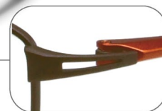
ゴムメタル製ヨロイ