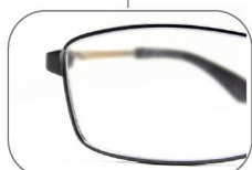
スポーティデザイン