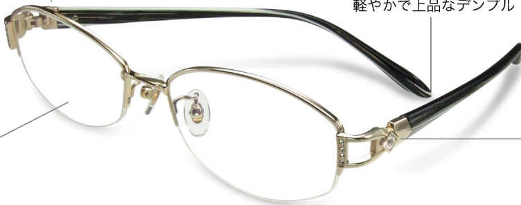
遠近両用レンズ対応