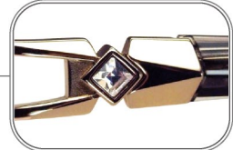
煌めきサイドで目元明るく！