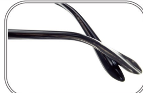
軽やかで上品なテンプル