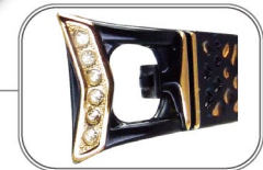
煌めくサイド飾り