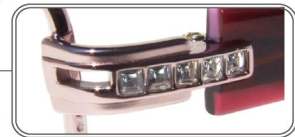
煌めきのラインストーン