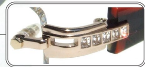
煌めきのラインストーン