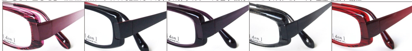
COL.2 Pink Stripe

DUN-2045 フルリム LADIES' 01170 サイズ: 52□15-140(±31.0) / カラー: 5色 / 素材: ゴムメタル、アセテート / 生産地: 日本・鯖江