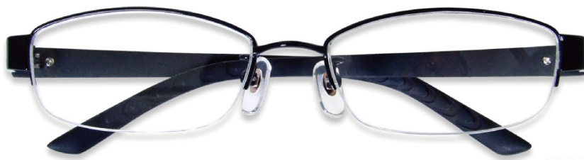
DUN-2049 COL. 4