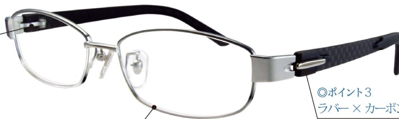
DUN-2048 COL. 17