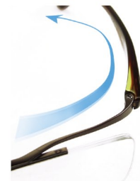
ヘッドア라운드フォルム