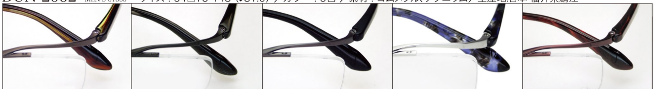
COL.3 Brown Mat

DUN-2062 ナイロール MEN'S 01350 サイズ：54□16-143 (±31.0) / カラー：5色 / 素材：ゴムメタル、チタニウム / 生産地：日本・福井県鯖江