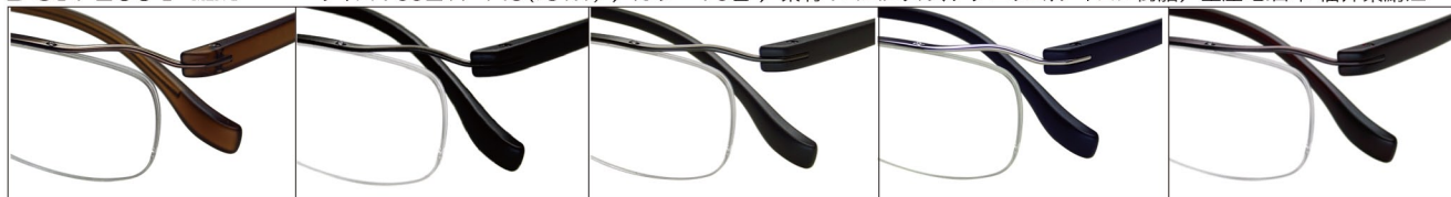
COL.3 Brown/Clear Brown

DUN-2064 ナイロール MEN'S サイズ：55□17-143(♯31.1) / カラー：5色 / 素材：ゴムメタル、チタニウム、ナイロン樹脂 / 生産地：日本・福井県鯖江