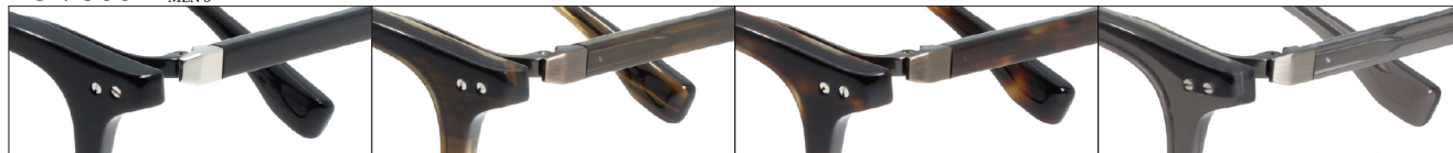
COL.BKTI Black Titanium COL.BRSBR Brown Sasa Brown COL.DDBR Dark Demi Brown COL.SMKGRS Smork Gray Shirring

DUN-9004 フルリム MENS サイズ: 48□22-145 (¥38.7) / カラー: 4色 / 素材、生産地: 上記同様