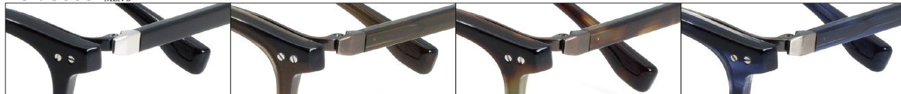
COL.BKTI Black Titanium COL.BRHBR Brown Half Brown COL.DDBR Dark Demi Brown COL.NVSGRS Navy Sasa Gray Shirring

DUN-9005 フルリム MENS サイズ: 52□20-145 (¥36.7) / カラー: 4色 / 素材、生産地: 上記同様