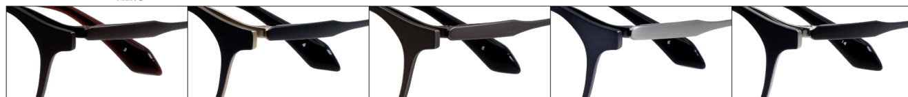
COL.3 Brown Mat COL.4 Black Mat(Gold Mat) COL.5 Gray Brown COL.6 Blue Mat/Titanium Mat COL.14 Black(Silver)

DUN-6012 フルリム MEN'S サイズ: 48□19-140 (¥40.1) / カラー: 5色 / 素材: βチタン、チタニウム / 生産地: 日本・福井県鯖江