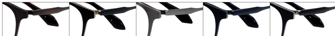
COL.3 Brown Mat COL.4 Black Mat(Gold Mat) COL.5 Gray COL.6 Blue Mat(Gray Mat) COL.14 Black(Silver)

DUN-6011 フルリム MEN'S サイズ: 48□20-140 (¥39.0) / カラー: 5色 / 素材: βチタン、チタニウム / 生産地: 日本・福井県鯖江