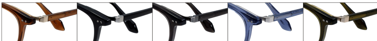
COL.3 Clear Brown(Gold) COL.4 Black(Titanium) COL.5 Clear Gray(Gray Mat) COL.6 Clear Blue(Silver) COL.19 Clear Green(Gold)

DUN-6013 フルリム MENS サイズ: 48□20-143 (±39.0) / カラー: 5色 / 素材: アセテート、βチタン、チタニウム / 生産地: 日本・福井県鯖江