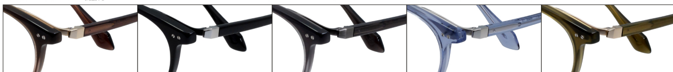
COL.3 Clear Brown Gradation (Gold) COL.4 Black(Titanium) COL.5 Clear Gray Gradation (Gray Mat) COL.6 Clear Blue(Silver) COL.19 Clear Khaki(Gold)

DUN-6014 フルリム MENS サイズ: 50□20-143 (±41.5) / カラー: 5色 / 素材: アセテート、βチタン、チタニウム / 生産地: 日本・福井県鯖江